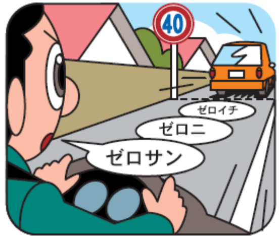
図2 速度ごとの車間時間と距離

また、高速道路の場合は、3秒でも停止距離に達していませんから、4秒以上の車間時間をとるようにしましょう。